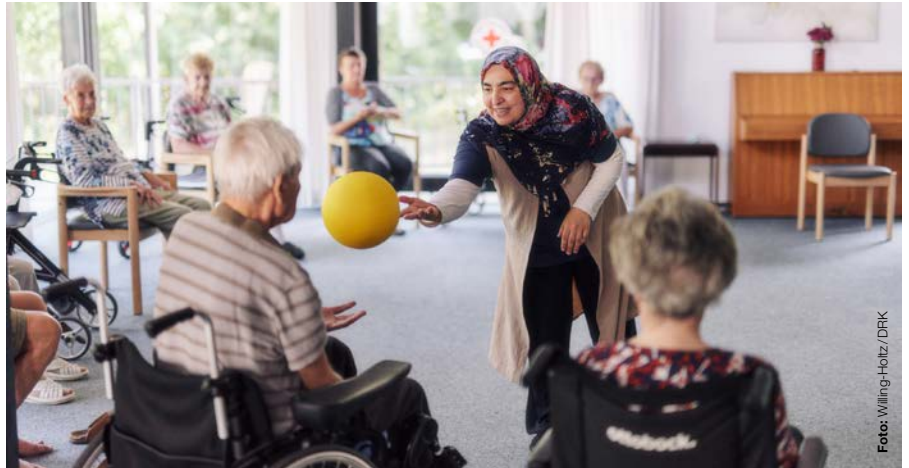
„Wir sind mit allen für alle da“ – das ist die Kernaussage des Positionspapiers

Das DRK ist aufgrund des Selbstverständnisses als offener, breit aufgestellter Verband prädestiniert dafür, beim Thema „Teilhabemöglichkeiten“ eine Vorreiterrolle einzunehmen. Die Grundsätze der Rotkreuz- und Rothalbmond-Bewegung sind die Basis für alle Aktivitäten und prägen die Haltung der Mitwirkenden. Im Roten