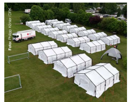
Zelte aus der Bundesvorhaltung des DRK kamen beim JRK-Supercamp 2025 zum Einsatz

Der neue Bevölkerungsschutz-HUB Luckenwalde dient als zentrale Logistik-, Ausbildungs- und Einsatzunterstützungsbasis. Die weiträumigen Lagerflächen bieten Platz für die umfangreiche Materialvorhaltung. Zukünftig werden in dem HUB auch Schulungen, Unterweisungen, Qualifikationen sowie Aus- und Fortbildungen von Einsatzkräften aus dem Gesamtverband stattfinden. Zudem kann der Einsatz