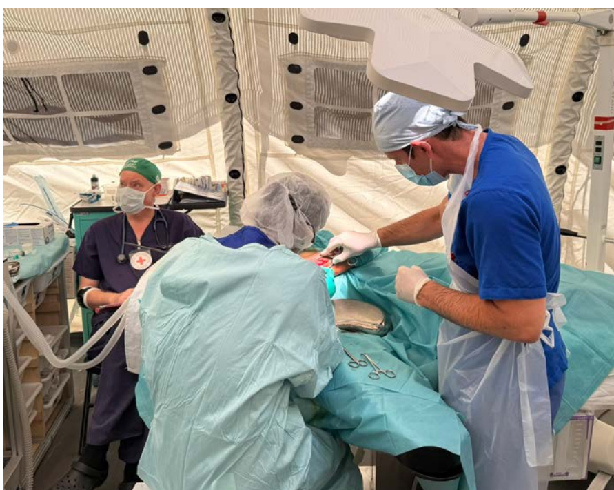
OP im Feldkrankenhaus: Die häufigsten Verletzungen sind Schusswunden