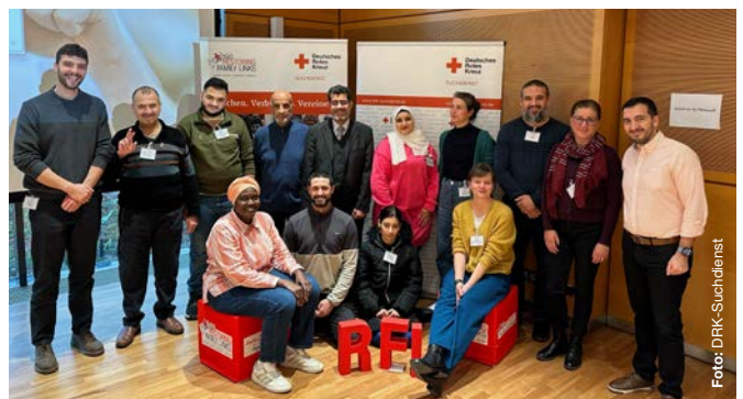
Die Teilnehmenden der Internationalen Familienkonferenz 2025 im DRK-Generalsekretariat